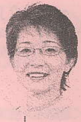
環境経済常任委員会所属