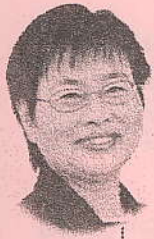
文教福祉常任委員会所属