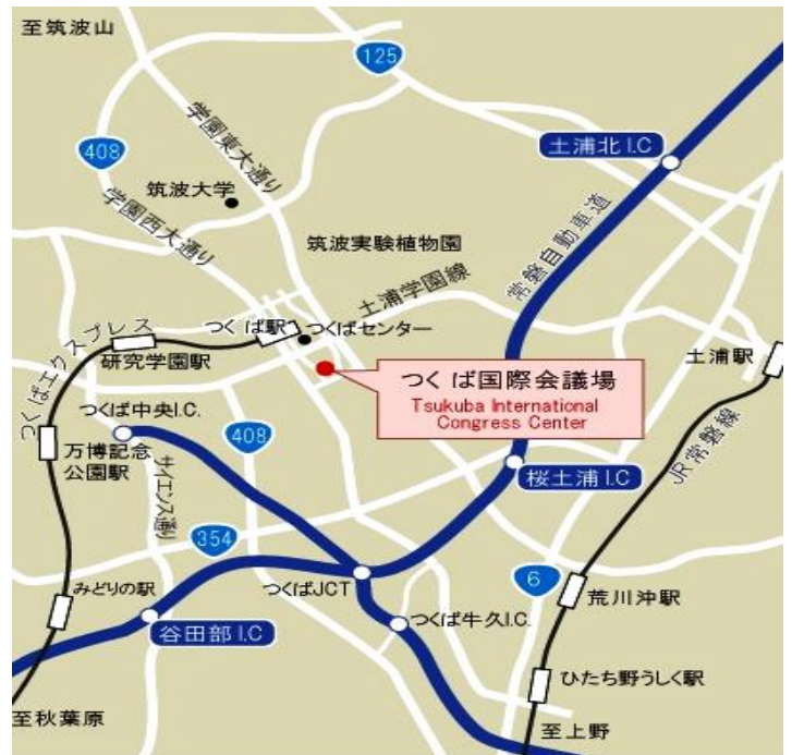
※会場周辺駐車場案内地図(裏面参照下さい)