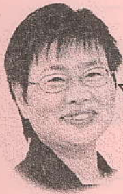
つくば市議会議員