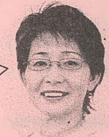
つくば市議会議員