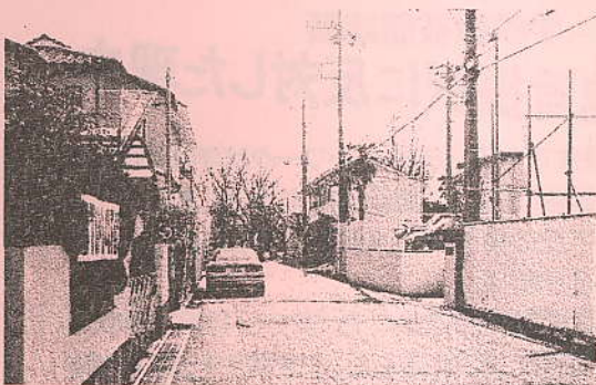
※千現1丁目マンション計画地(右)とのまのりや看板で抗議する周辺住民

その結果、他の事情も重なって高度地区告示に工事開始が間に合わなくなり、建設中止に至った。「自分達の街を守りたい!」という住民の強い思いと行動力が実を結んだ大きな成果だ。今後は高度地区に次ぐ第2、第3の住環境政策が必要だ。まずは住民が「どんなまちにしたいか」を地域で話し合い、市へ意見を届けよう!